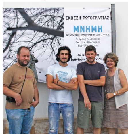
Οι τρεις νέοι φωτογράφοι στην είσοδο της έκθεσης

Η βοήθεια και η συμπαράσταση στα σχολεία, σε μαθητές και μερικές οικογένειες τους είναι, με τις σημερινές συνθήκες, για την «Panos&Cressida4Life» ο πιο ασφαλής και τρόπος βοήθειας ομώνυμων παιδιών και νέων σε ανάγκη.