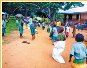
Maborotokoni kids. Σ' όλο τον κόσμο τα ίδια παιχνίδια...

Πέμπτος χρόνος που το «Νηπιαγωγείο μας», που κατασκευάσαμε εξ ολοκλήρου το 2009, λειτουργεί άψογα.