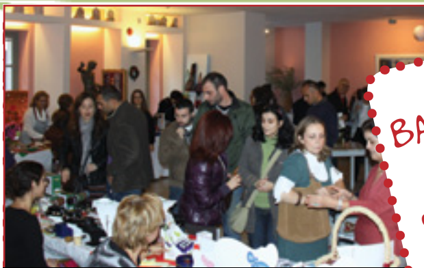
Το περινό Bazaar στο Ιωνικό Κέντρο