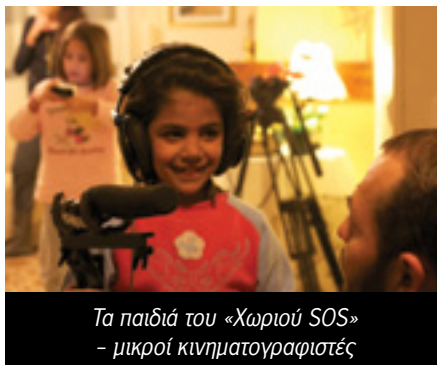
Τα παιδιά του «Χωριού SOS» - μικροί κινηματογραφιστές