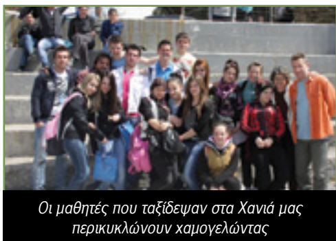
Οι μαθητές που ταξίδεψαν στα Χανιά μας περικυκλώνουν χαμογελώντας

Το Γενικό Λύκειο Γλαύκης με μαθητές, αποκλειστικά παιδιά των Πομάκων, κατά το σχολικό έτος 2010-11, ξεκίνησε ένα πρόγραμμα ανταλλαγής-συνεργασίας με το 4ο Λύκειο Χανίων, όπου τα παιδιά επικοινωνούσαν με διάφορα μέσα που τους παρείχαν τα σχολεία τους. Στόχος ήταν να δημιουργηθεί μία σχολική γέφυρα από τα δύο ελληνικά άκρα - την αστική περιοχή της Κρήτη με την αγροτική ορεινή περιοχή της Θράκης.